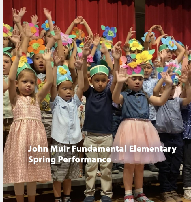
John Muir Fundamental Elementary Spring Performance

SAUSD está trabajando con nuestro socio de pruebas COVID-19 MEDLAB2020 para proporcionar cuatro ubicaciones de centros de pruebas este verano para estudiantes, personal y la comunidad. Pronto se proporcionará más información sobre estos sitios de prueba.